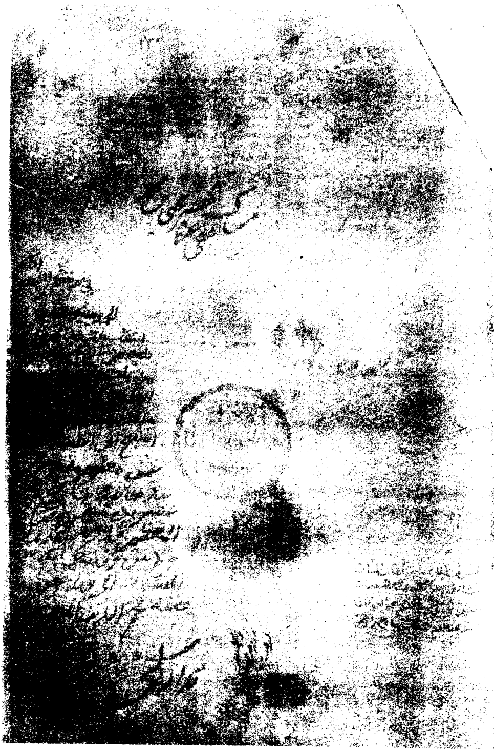
صورة الصفحة الأولى من الجزء الأول نسخة ( ب ) برلين