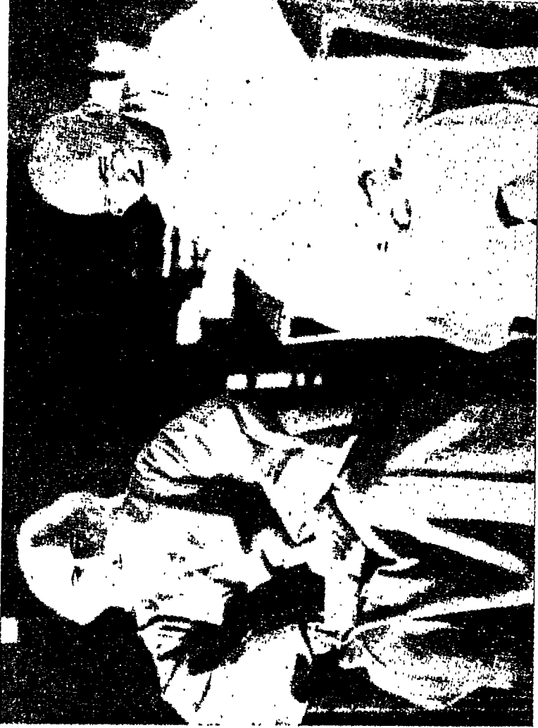
خاندي و تاجور