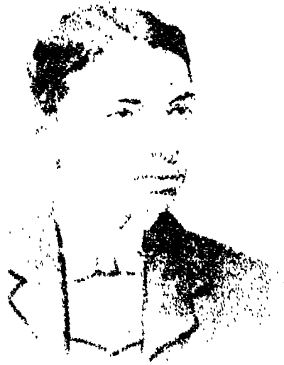
غاندى فى الجامعة