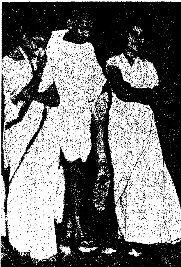
غاندى بين حفيدتيه