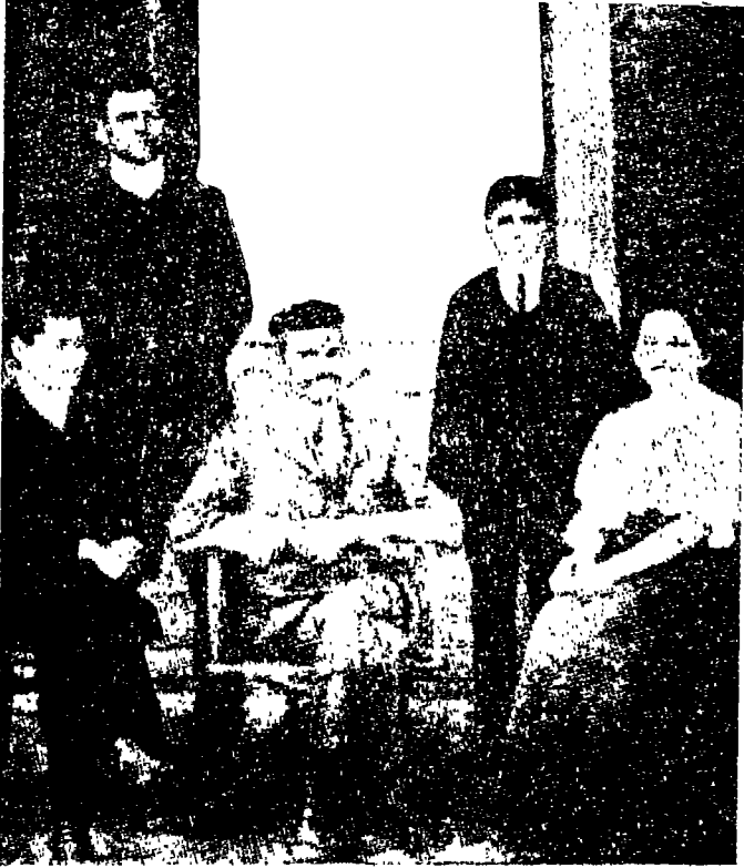
غاندى فى أفريقيا الجنوبية