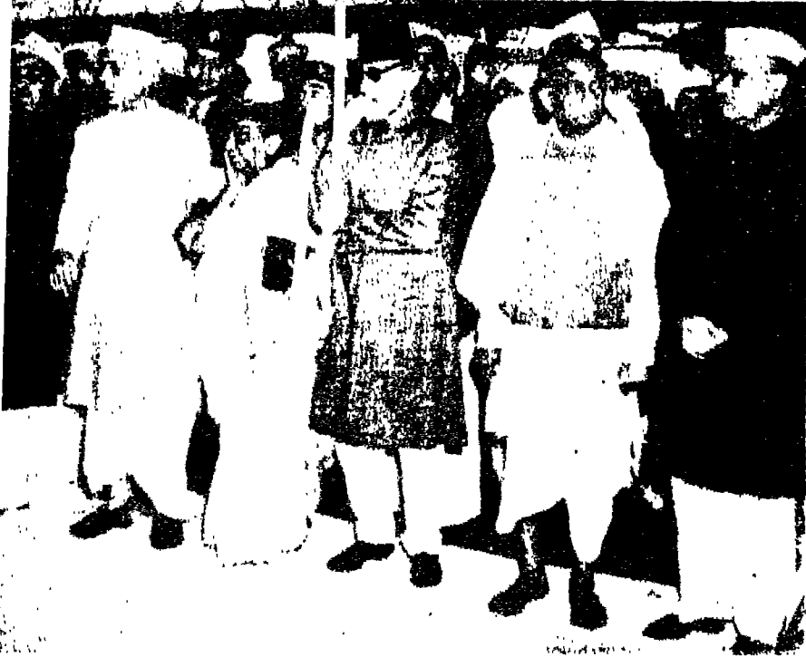
عطاء الهند ينتظرون جثمان غاندي في الوسط : سردار باتل ، وأبو الكلام آزاد ، والشاعرة نايدو ، ونهرود