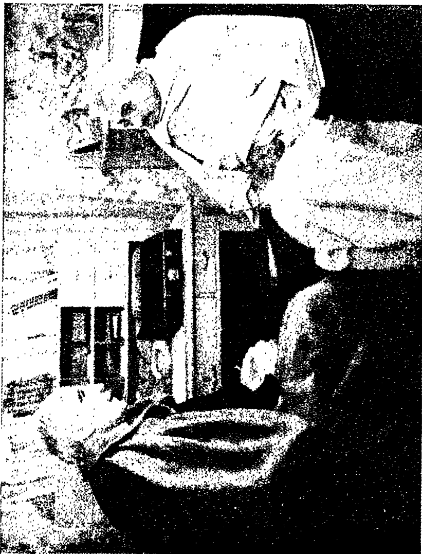
خانگی در روماندولان