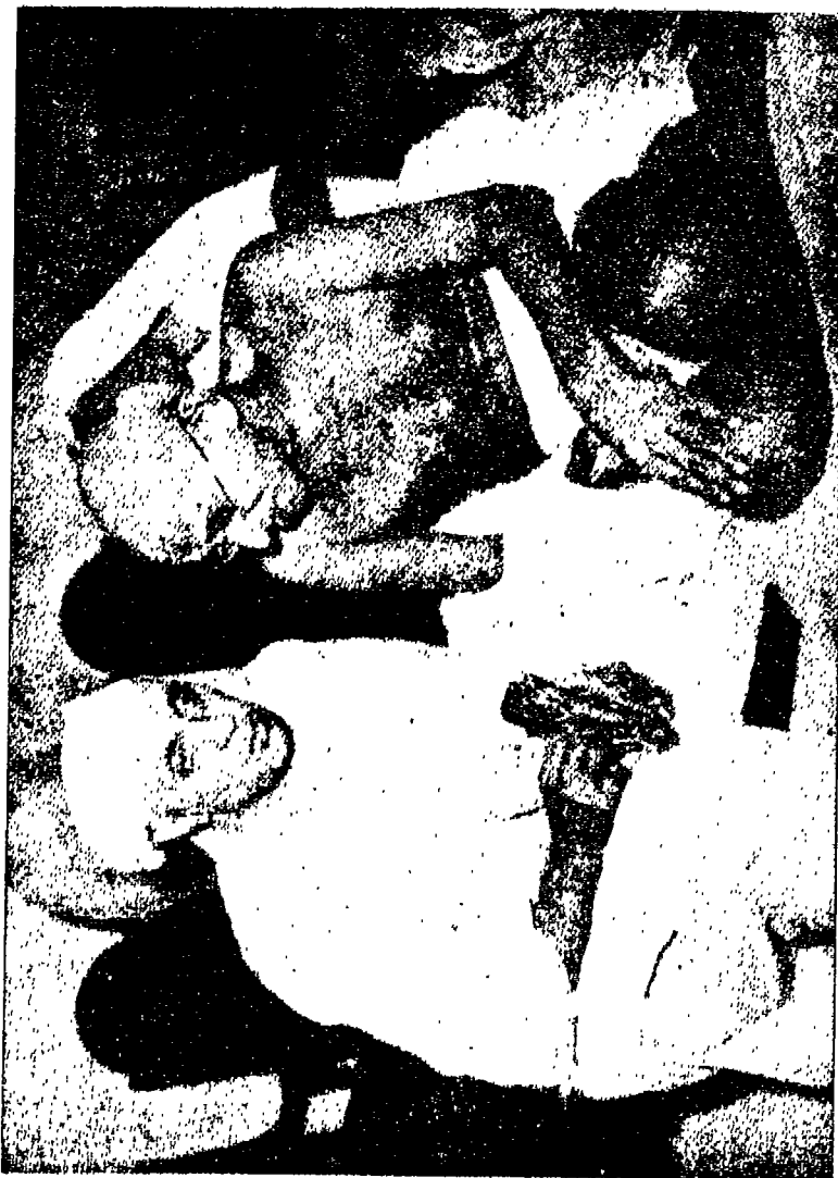
نهر و رئيس الحكومة الهندية يصتفي الى غاندي