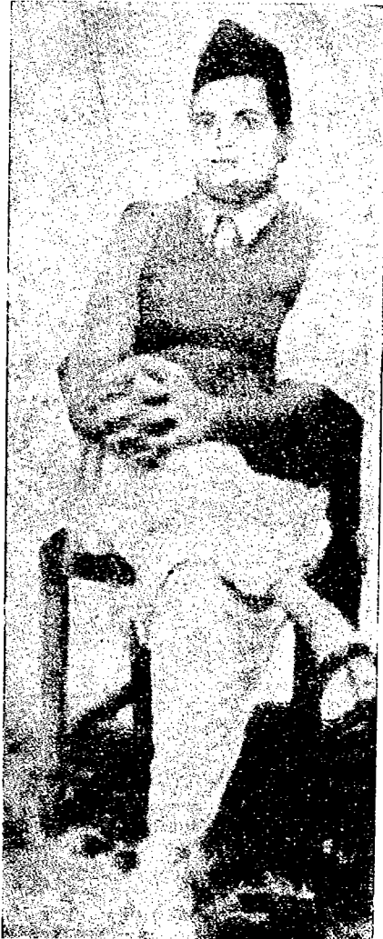
« جودس » قاتل خاندي