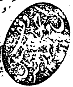
الصفحة الأخيرة من المخطوطة

بن نوفل مائة سنة وخمسة عشر سنة وقال ابو نوح كان لشرح بن الحارث القاضي يوم مات مائة وثمانين سنة وقال زائدة بن قدامة عتبة بن ربيعة ابن ارضين ومائة سنة انشكر الجزوه وجز من عاش مائة وعشرين سنة من الصابة وفي القوم عنهم من جمع الحافظ الى اوكروا حتى من عند الوهاب بن محمد الاضنه في رحمة الله عليه وعلقه لنفسه يونس بن ملاح الحسني المتوفى غر الله له ولوالديه ولشايخه والمسلمين ولا حول ولا قوة الا بالله العلي العظيم