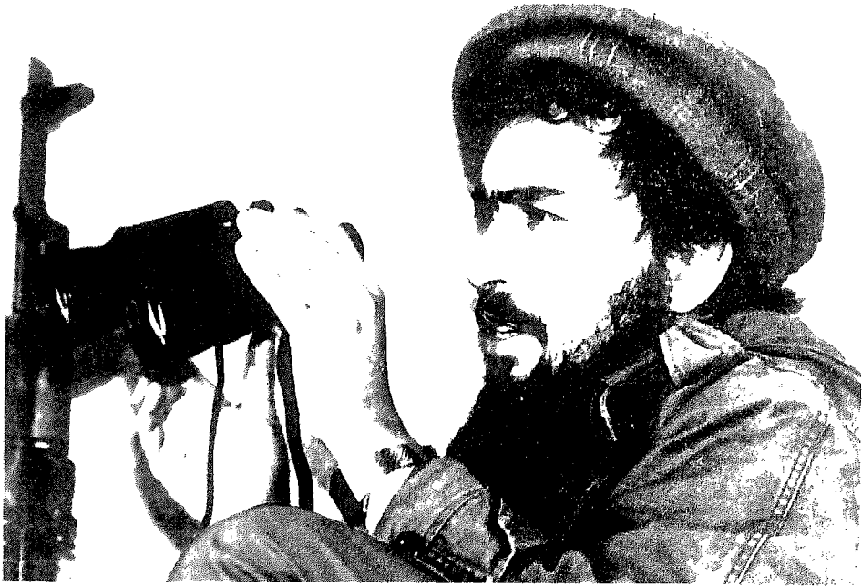
ذبيح الله أمير ولاية مزار الشريف .