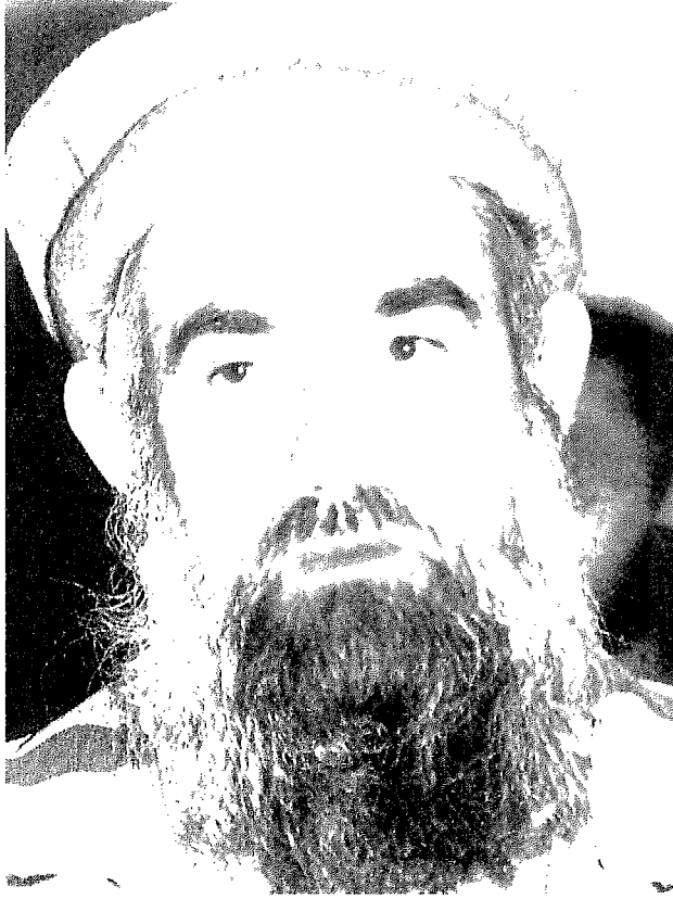
عبد الله عزام في آخر أيامه .