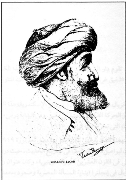
الجنرال يعقوب حنا

(نقلا عن كتاب همصي الجنرال يعقوب صحيفة ١١٣)