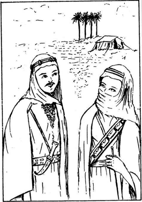
الأمير الشاب الهارب يلتقي بالفارس المثلث في الصحراء ويسيران معاً في طريقهما المجهول.!!