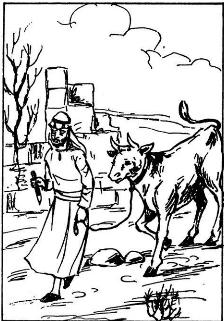
السارق يقود الثور إلى مصرعه في خربة من الخربات