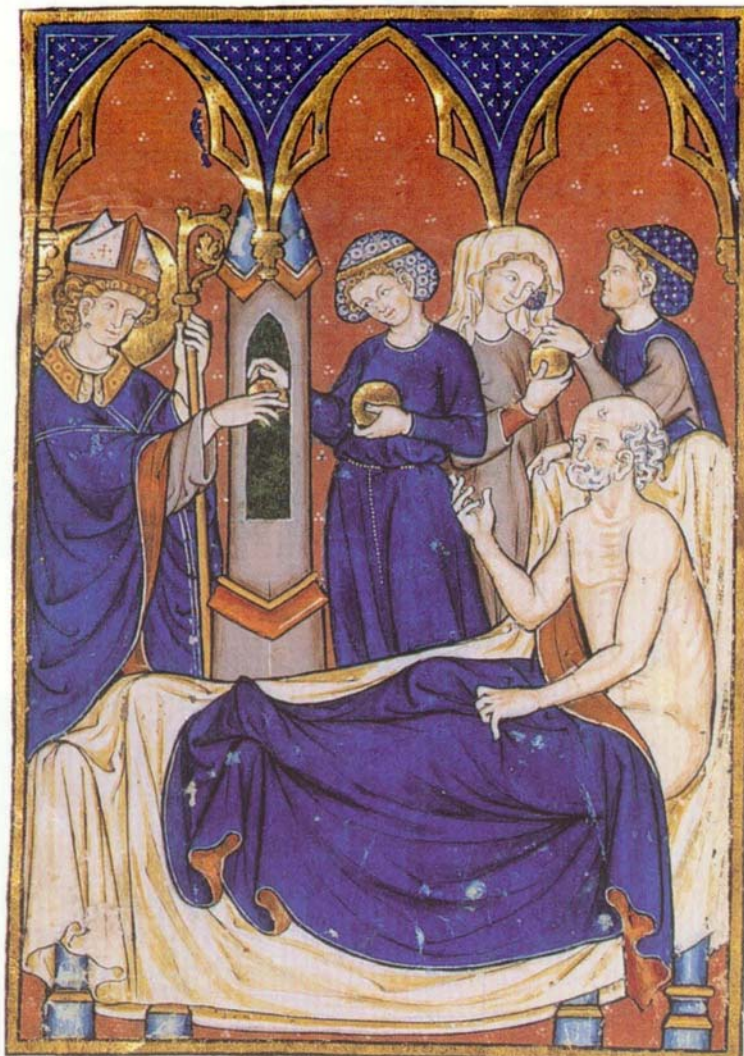
الشكل رقم (3) : لوحة «هيمنة اللون الأزرق وصدقات القديس نيقولا». وتُظهر اللوحة صورة المسيح في صحبة القديسين. باريس في القرن الثالث عشر.