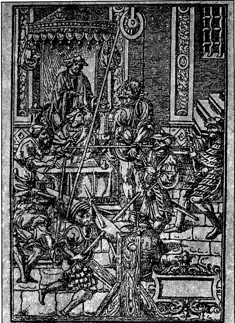
منظر شنيق و تلاميذ