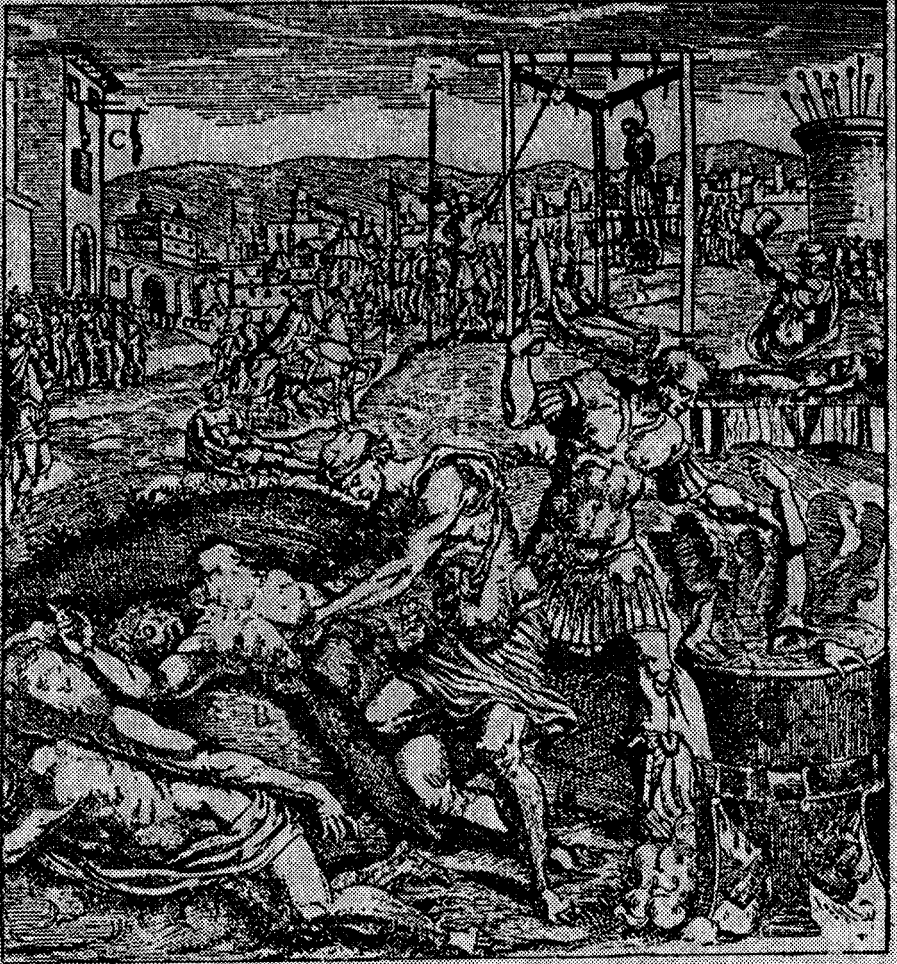
حمام الدماء ( منظر تعذيب )