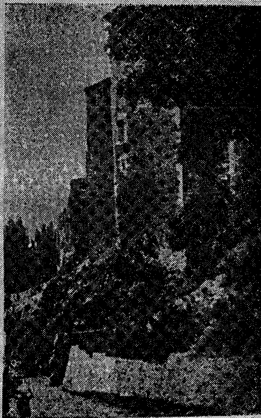
بناؤ قديم بكونيكا بأسبانيا وجدت به سجون القفطيش