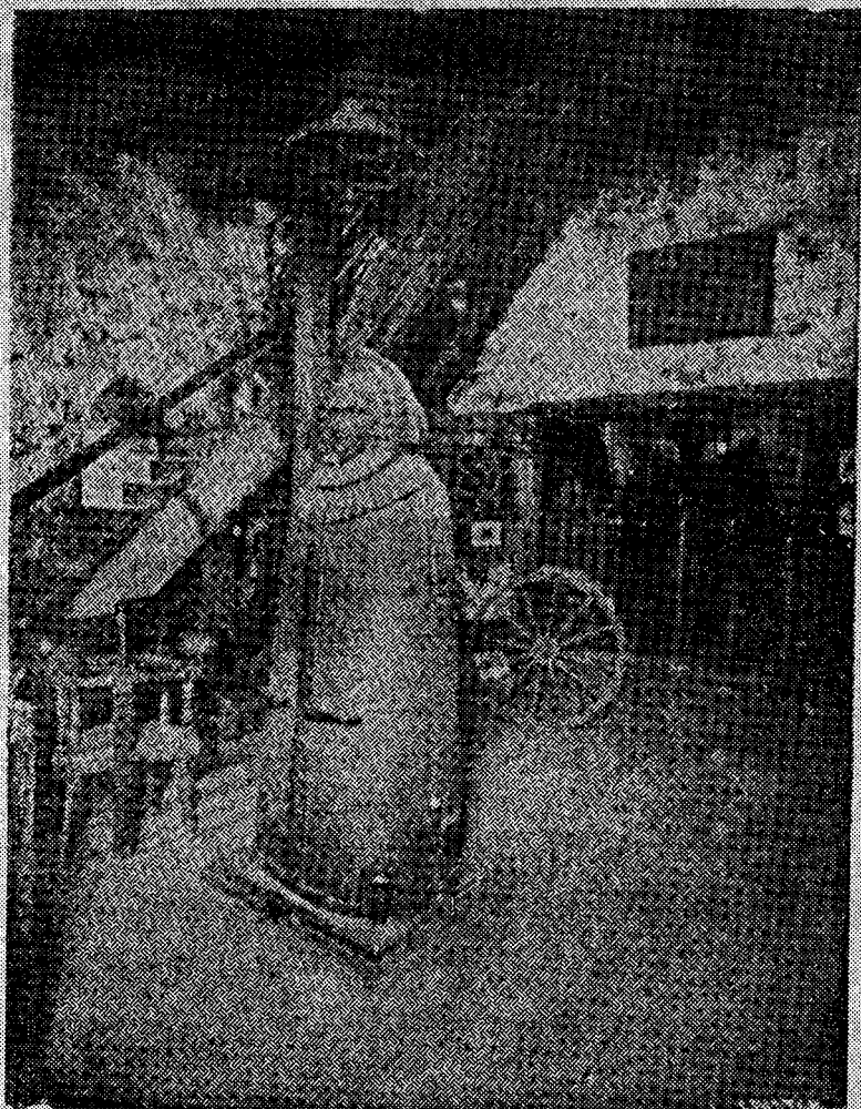
الفتاة البكر الحديدية