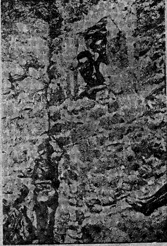
منظر داخلي لغرفة سجون التفطيش تظهر فيه جثث بعض الضحايا