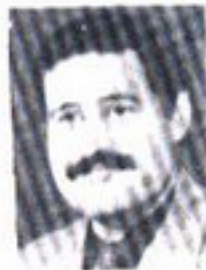
د. نبيل فاروق