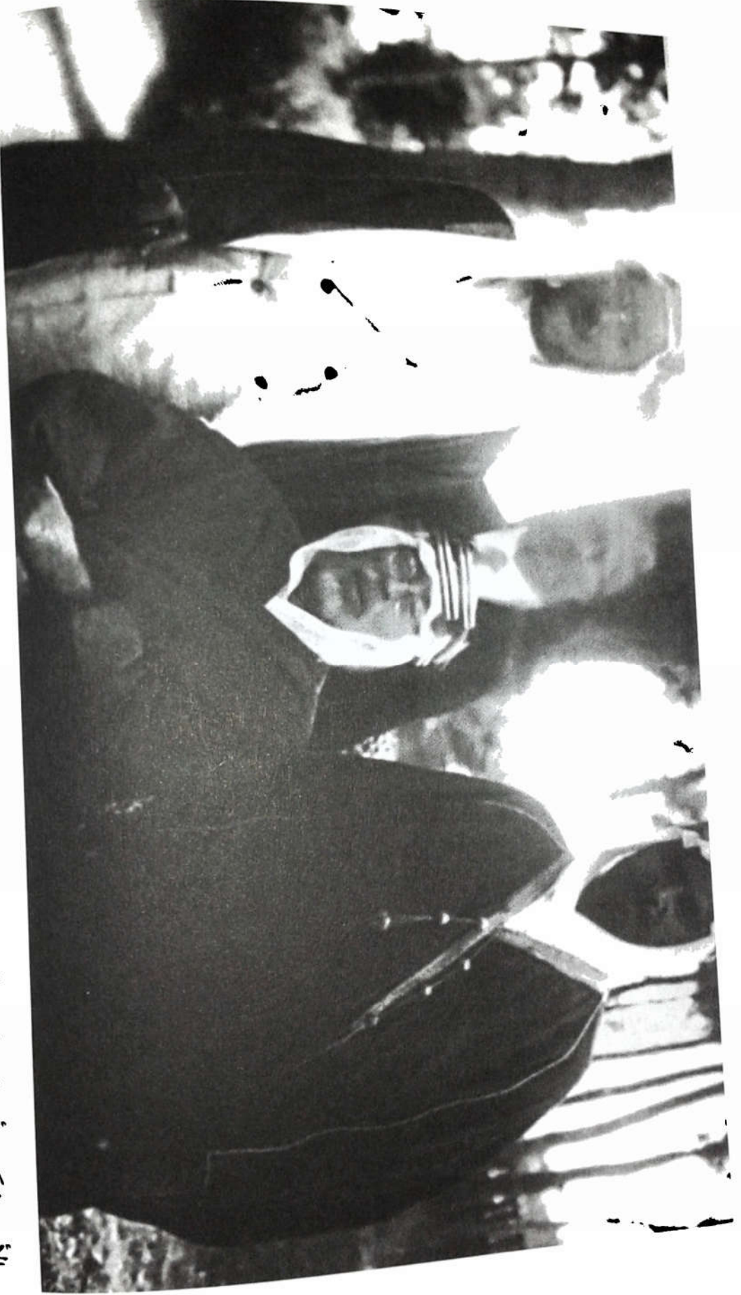
الأمير شكيب أرسلان في الزيّ العربي لدى زيارته للمحجاز لأجل الصلح ما بين الأستاذ الإمام، والإمام يحيى ديني ابن سعود، وكان معه حضرة أمين الحسن وعلوية باشا من مصر - ١٩٣٤.