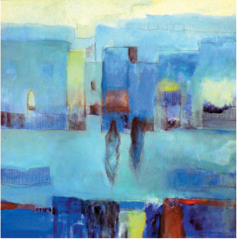
لوحة بريشة الفنان الكويتي عادل الخلف