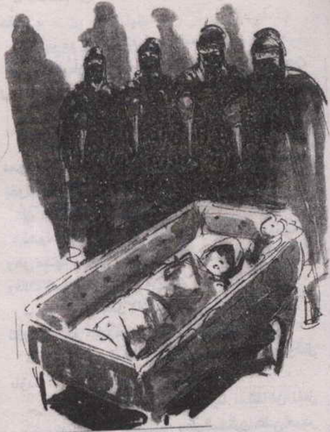
وهناك رأتهم يقفون حول مهد الصغيرة ..

حينما سمعت القسم يتردد في أرجاء المنزل ..