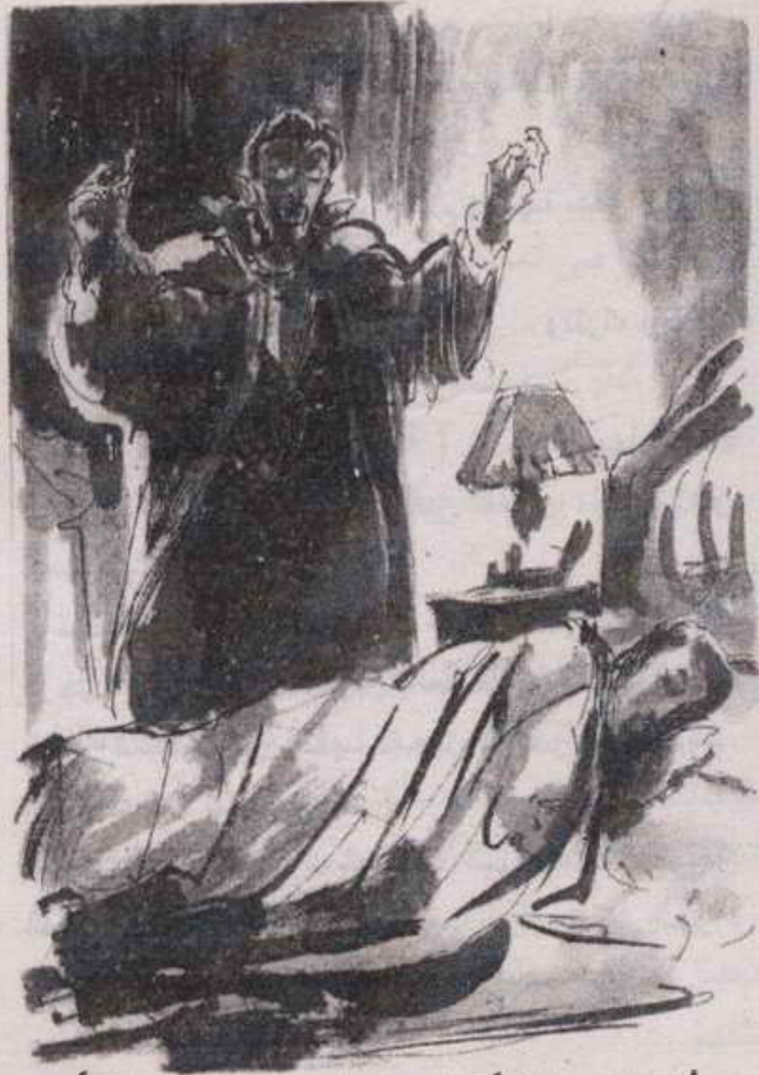
أما صاحب الظل فتراجع للوراء ، ورفع الذراع المغطاة بالعباءة ليحجب الضوء عن عينيه ..