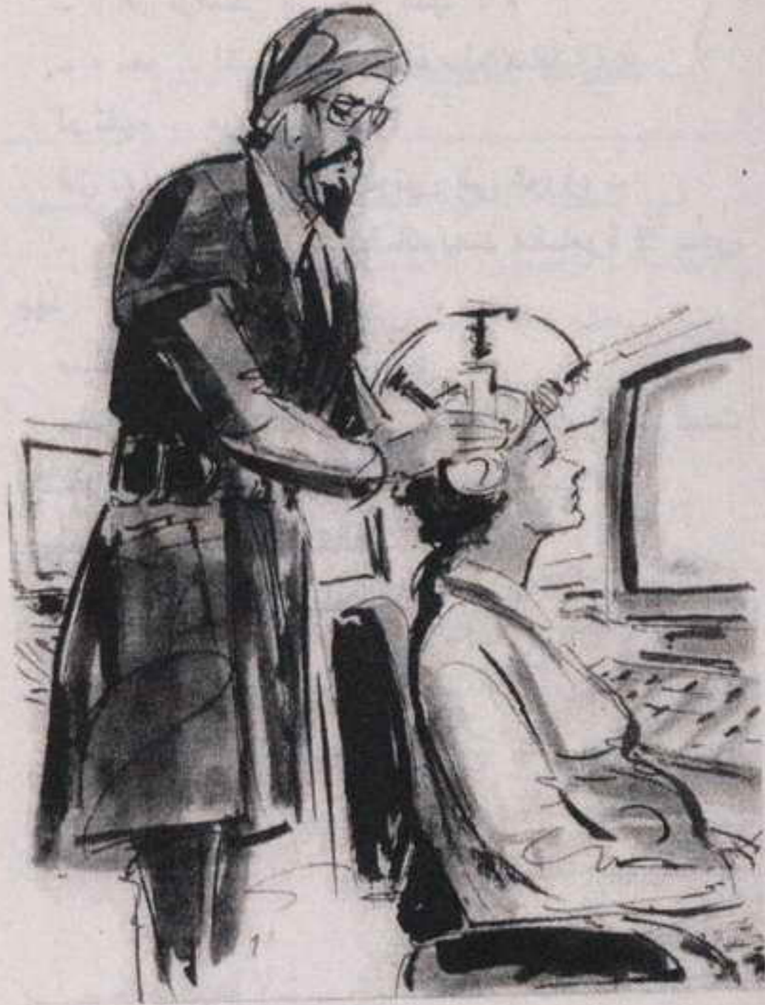
رأته يتناول أقطاب جهاز رسم المخ فيثبتها بعناية حول رأسها ..