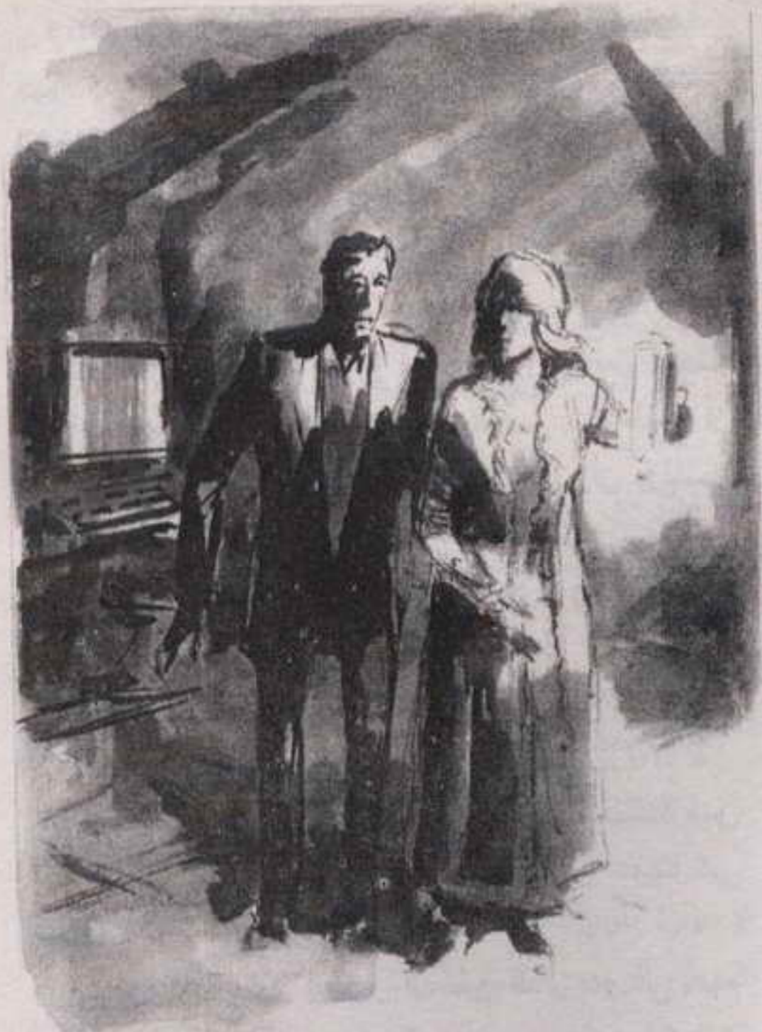
راحا يتأملان الغرفة في ضوء ( النيون ) الأبيض المزرق البارد من كشاف الطوارئ ..